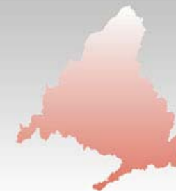
GRÁFICO SOBRE PRESUPUESTO DESTINADO A CONCIERTOS DE ASISTENCIA SANITARIA